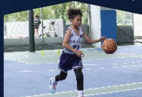
分齡訓練 ⚡ 台北、新北、新竹、台中、台南、高雄、花蓮

你是否渴望接觸更專業、更高強度的訓練？是否可望擊敗更強的對手？同時也在找尋一群目標一致的好隊友呢。EMPOWER RISE 比擬 HBL、UBA 甲組校隊的訓練規格，每月扎實的訓練安排，更在月底透過對抗賽檢視訓練成果！