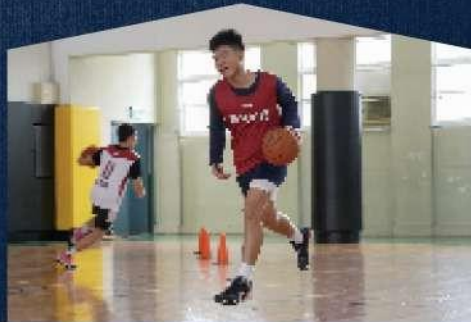
16-22歲 ⚡ 台北、新竹

以「球隊」概念運作的週末籃球俱樂部，不同於訓練營形式的教學，我們把參加的學員們視為球隊選手，擁有自己專屬的球衣背號，各隊也擁有專屬隊名及主場，配置固定的教練團隊，每周固定訓練，每月定期比賽。