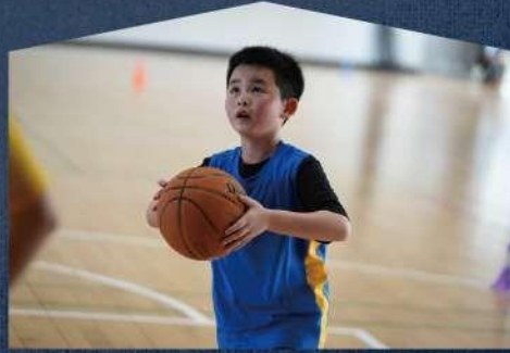
6-10歲 ⚡ 台北

提供12歲以上女生專屬的常態訓練營，我們提供給熱愛籃球的女孩子，一個友善、安全的訓練環境，我們提供想學習籃球相關的女生，規律有系統的課程，讓女孩們可以無憂無慮的參與籃球運動！