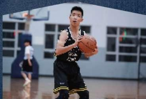
9-15歲 ⚡ 台北、新北、新竹、台中

EMPOWER Rookies 提供6-10歲的孩子基礎的籃球訓練，透過基礎籃球訓練，帶領孩子們逐步認識籃球運動、培養對於運動的興趣，並希望在與同儕一起訓練的環境下，學習團隊合作的精神。