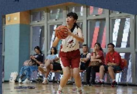
12↑歲 ⚡ 台北